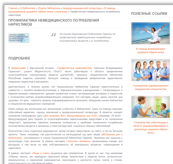
Рис.2 Статья справочного характера

В тексте статьи Вы найдете активные ссылки на следующие ресурсы: