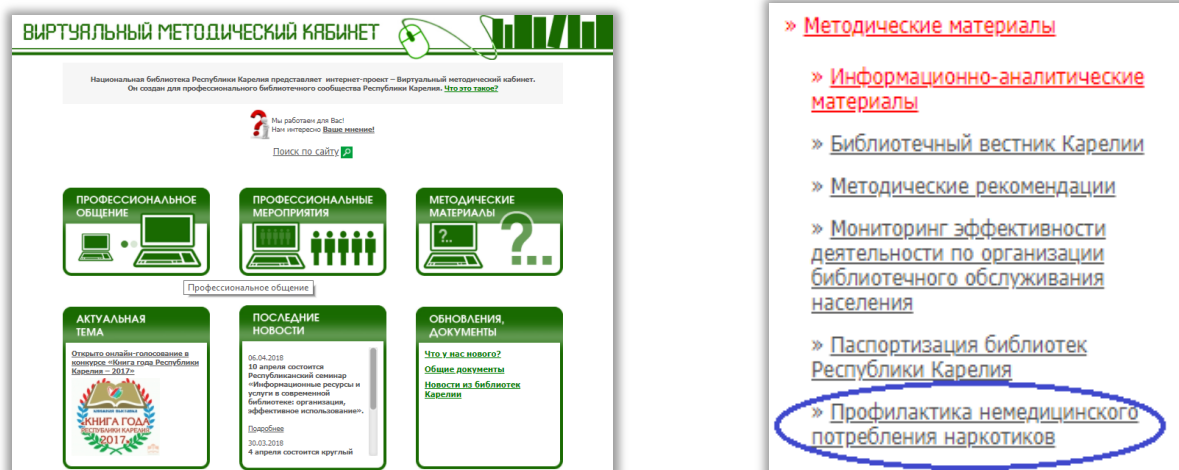
Рис. 3 Отсылка к ресурсу из Виртуального методического кабинета

Получить доступ к информации по профилактике немедицинского потребления наркотиков можно так же из Виртуального методического кабинета (одноименный тематический подраздел в меню раздела «Методические материалы», Рис.3).